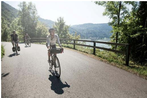
Genussradfahren am Donauradweg