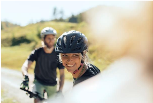
Mountainbiken in Pyhrn-Priel