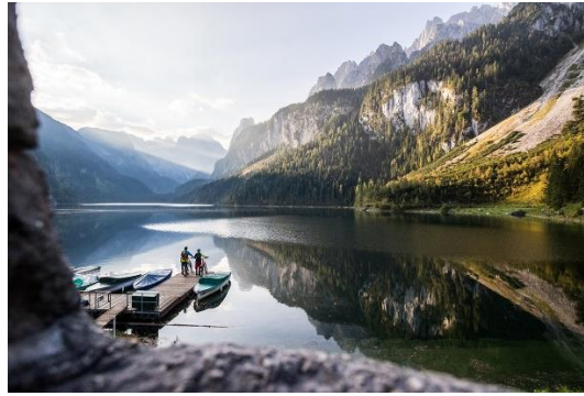
Am BergeSeen eTrail im Salzkammergut, Foto: Oberösterreich Tourismus/Moritz Ablinger